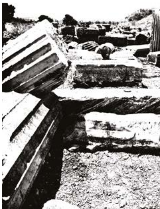
Victor Sirot - Le Printemps Arabe - Créations dans le cadre des Nuits D'Orient 2018