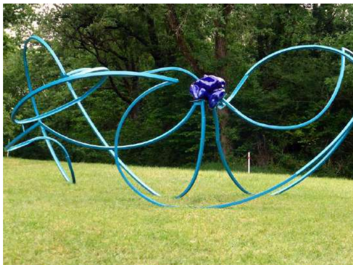
Pierre-Alexandre Rémy: Echo au chaos- 2017