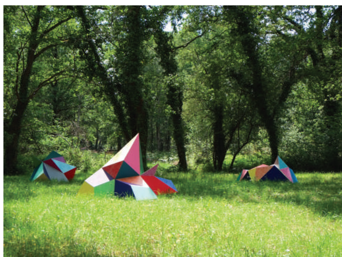
Elodie Boutry : Sous-bois - 2018