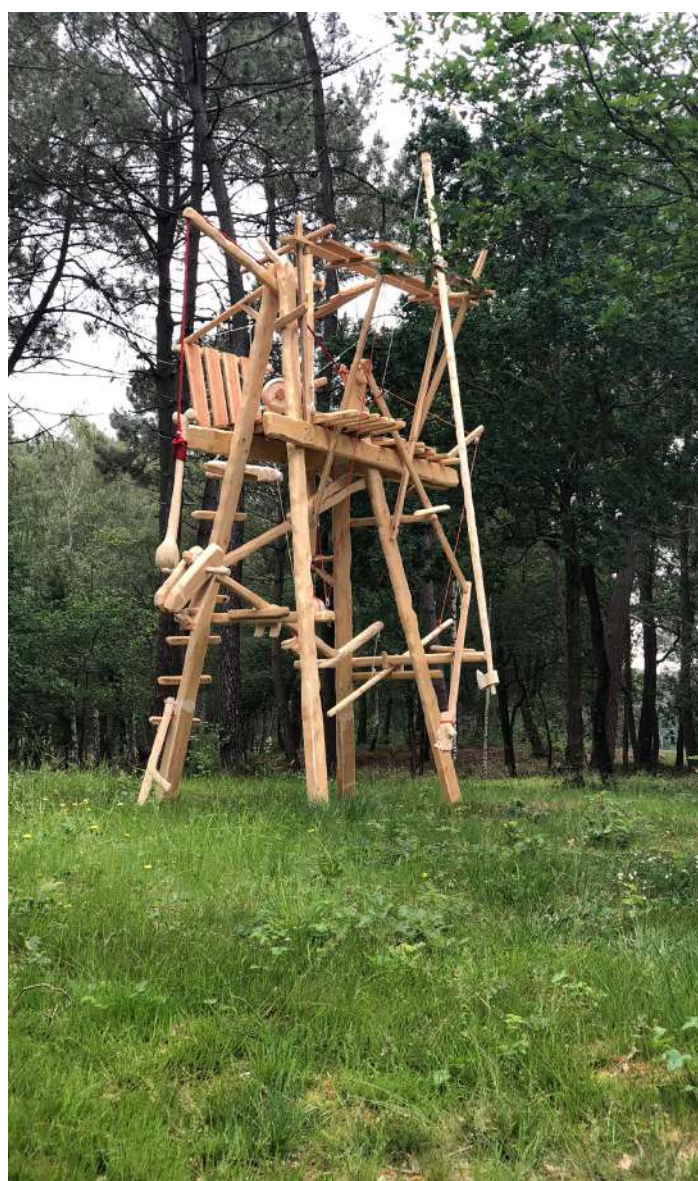
Mathieu Archambault de Beaune : Cheval, cheval, cheval, ni oui ni non - 2018