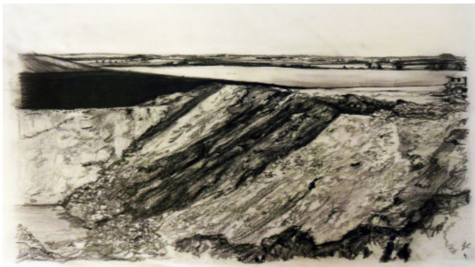
Source : Terres en mouvement - Site d'ECT de Maissy-Cramoyel © Marie-Laure Garnier