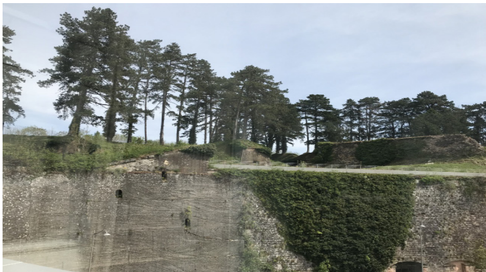
Source : Les jardins suspendus de l'École d'art de Belfort ©École d'art de Belfort

> Conférences Jeudi 25 février de 18h à 20h