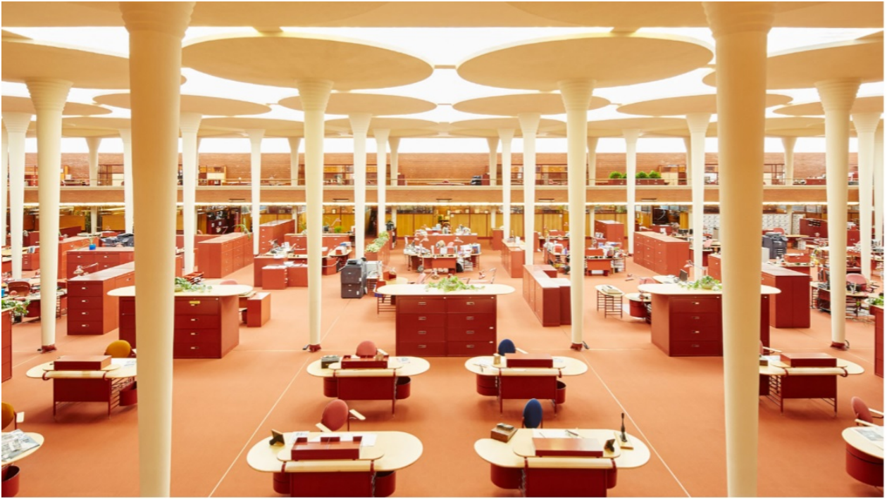
Frank Lloyd Wright, Édifice administratif de SC Johnson, 1936

ANNEXE 1. Pour le sujet 2, cinq images sur deux pages.