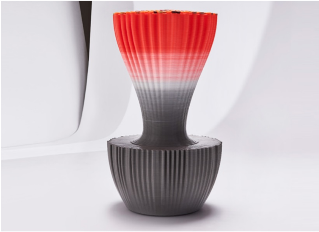
Ross Lovegrove & Nagami, Robotica TM , 2018