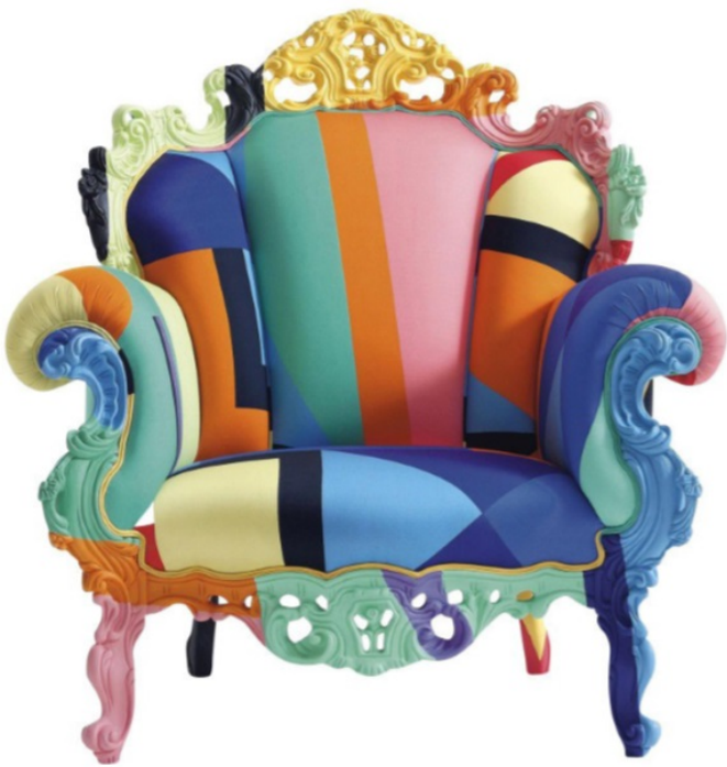
Alessandro Mendini, fauteuil Proust , 1978