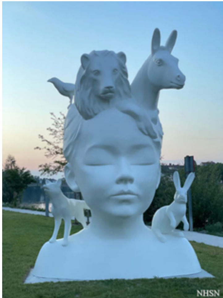
Nathalie Tallec, La grâce plus belle encore que la beauté , biscuit de porcelaine, Château-Thierry, 2021.