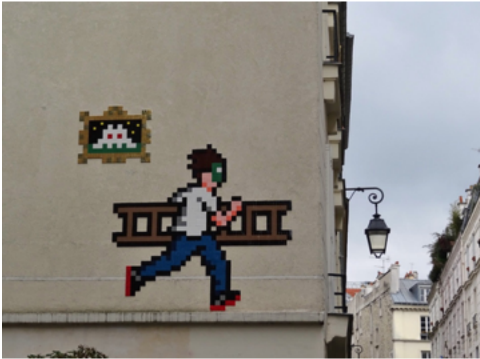
Invader, Autoportrait , mosaïque sur panneau, rue Volta, Paris, 2017.