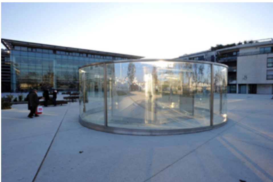
Dan Graham, Kaleidoscope/Doubled , verre réfléchissant, acier inoxydable, sol bois, La Rochelle, 2010.