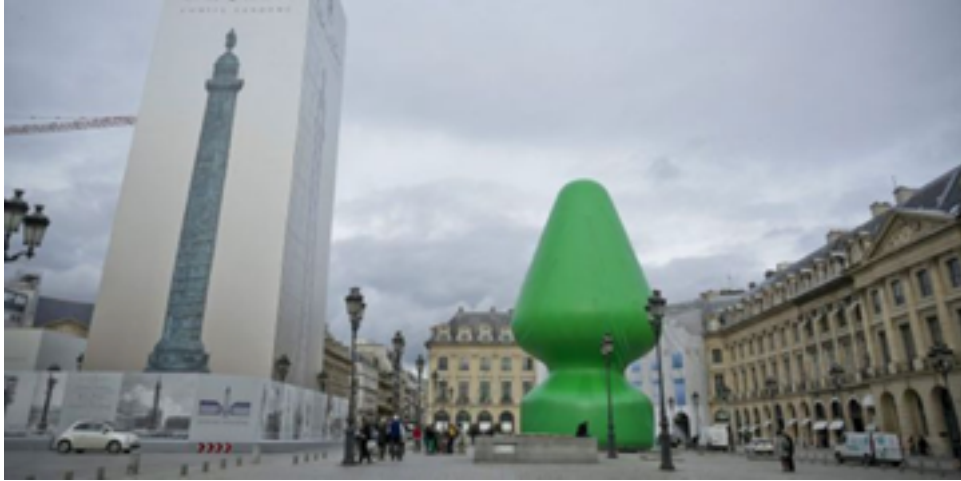
Paul McCarthy, Tree , sculpture gonflable, place Vendôme, Paris, 2014.