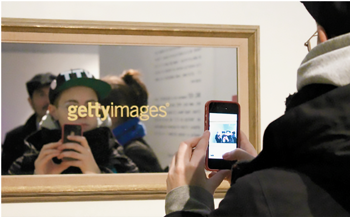
Geraldine Juárez, Getty Images , lettrage vinyle sur miroir, exposition Snel Hest. Konst och konstig mediahistoria, Alingsås konsthall, Suède, 2014.