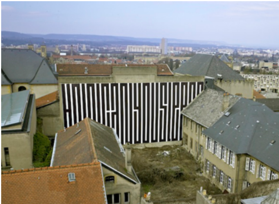
Tania Mouraud, HCYS? , Impression numérique sur bâche tendue, 15 x 30 m, FRAC Lorraine, Metz, 2005.