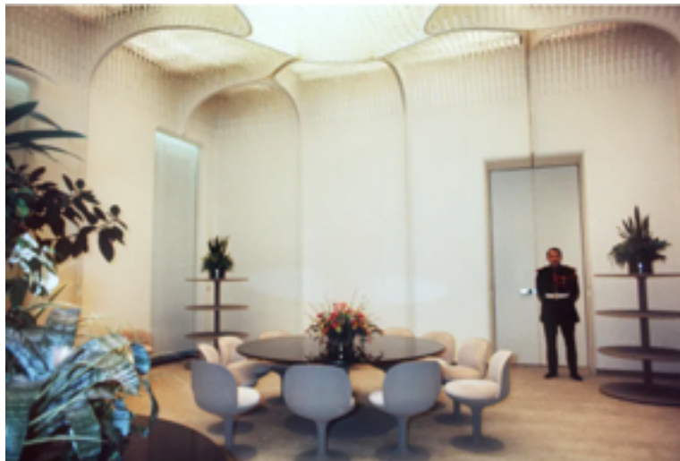
Pierre Paulin (1903-1966), Salon, Palais de l'Élysée, 1972.

En 1972, le président Georges Pompidou commande un décor au designer Pierre Paulin pour le palais de l'Élysée. Le Salon est conçu comme une œuvre d'art totale qui utilise de nouveaux matériaux, où le mobilier répond aux murs et au plafond. Cette pièce est le seul mobilier des années 1970 toujours installée au Palais de l'Élysée.