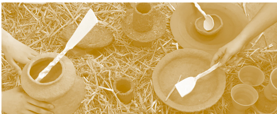
© Rose Barraud, Jihye Jung, Romane Lorient

19h30 | Banquet « Dépayser les goûts » créé par À la Table du paysage , Sébastien Argant – paysagiste dplg, avec la participation des élèves des DNSEP Magma et Design sonore de TALM-Le Mans, sous le regard des artistes Natsuko Uchino, Noémie Sauve, Rodolphe Alexis et Thierry Balasse ( sur invitation ) – TALM-Le Mans